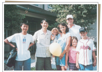
▲ 一緒に過ごしたホストファミリー

朝8時、朝食をとった後、9時半からのランچー-ジフォーカスタイムで、その日のアクティビティをトピックにして英語の勉強。ホストマザーが英語の上達に気を配り、きめ細やかな指導をしてくれる。自分のレベルに合わせた内容で個人授業が受けられ、自分でも日一日と英会話の力がついていくのがわかる。その後一緒に郵便局へ行き、手紙を出す際にホストマザーと郵便局の人の会話をキャッチ。自分でも少し内容が聞き取れたことが嬉しい。その足でスーパーでショッピング。お金を払うときに、スーパーの人が何か早口でホストマザーに聞いていたことがまったく聞き取れない。帰りの車の中でそのことを話すと、あの早口はポリ袋がいいのか紙袋がいいのかと尋ねたのだと教えてくれた。ショッピングをする時に必ず聞かれることなので暗記した。家に着いてホストマザーが料理するのを手伝う。料理しながら、これは英語でなんというのかとあれこれと質問攻めにしたが、ホストマザーは親切に教えてくれた。単語用に覚えたことを書きまくる。午後からはホームスクーラー達がスポンサーしたポリスステーションの見学と一緒に参加。警察署の見学などなかなかできない体験なので、緊張した。こういったアクティビティに参加すると、「自分もアメリカの社会の一員なんだ」という気がしてとても嬉しい。その後、ホストの子供とトランポリンで遊んだりしながら、子供たちと気兼ねなくグローウンイングリッシュを試してみる。英語をしゃべる勇気をつけるには子供と話すに限る。夕食時には日本のことをいろいろと尋ねられて英語で頭がいっぱいになった。日本のことを説明している英語の本を持ってきて良かった。今晚この本で勉強すれば明日の夕食には何とかなるだろう。食事の後は家族と一緒にテレビのニュースやコメディを見て家族の一員として馴染むようにがんばる。ニュースの英語は速すぎるし、コメディの落ちは作り笑いでつまかした。