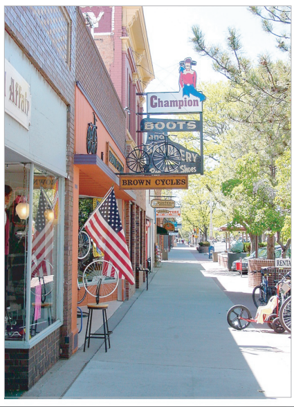
▲ Grand Junctionのダウンタウン

ホームステイプログラムは、各自のレベルに合わせて理想的な語学研修を受けることができます。しかもホームステイをしながら家族の一員として、ともにアメリカでの生活を体験することができることも多くの魅力です。現地には日本人ISC提携スタッフが常駐していますので、出発日・帰国日が自由に設定でき、現地でのサポートも万全です。